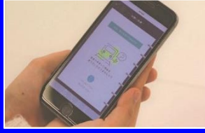
聴覚障害者に配慮した情報伝達手段の検討'19