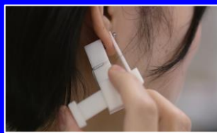
片麻痺の方のためのピアス装着自動具'20