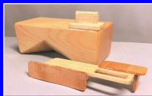
頸髄損傷者のためのネイルケア補助具'19