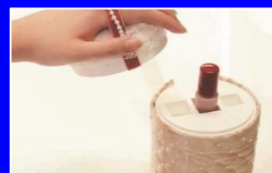
頸髄損傷者のためのネイルケア補助具'19