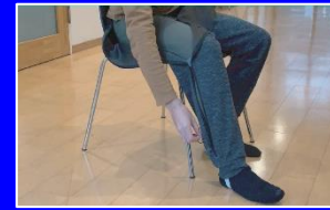
下半身が不自由な方のためのズボンの提案'20