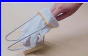
片手でグローブをはめられる自動具'19