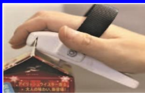
頸髄損傷者のためのストロー用紙パック開孔具'19