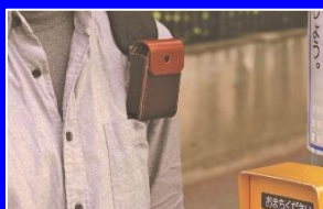
視覚障害者向けの歩行者信号認識カメラ'19