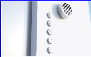
視覚障害者のための音声付きエレベータボタン'20