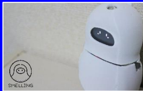
感覚鈍麻障害者のための匂いチェッカー'20